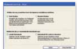
Setup Erweiterte Installation