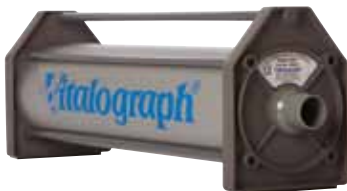
Kalibrationspumpe 3 Liter

Der internationale Spirometrie-Standard von ATS (American Thorax Society) und ERS (European Respiratory Society) empfiehlt eine tägliche Genauigkeitsprüfung aller Spirometer mittels 3-Liter-Kalibrationspumpe. Bei Spirometern von Vitalograph ist eine regelmäßige Überprüfung gemäß Spirometrie-Standard möglich, aber nicht zwingend nötig.