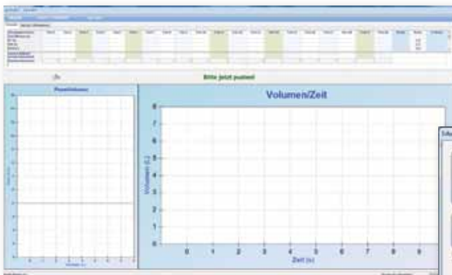
Test-Bildschirm mit der Meldung "Bitte jetzt pusten!"