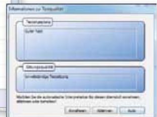
Informationen zur Testqualität